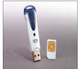
× شكل التوقيع الإلكتروني المستخدم في مصر المسمى بـ (Token)